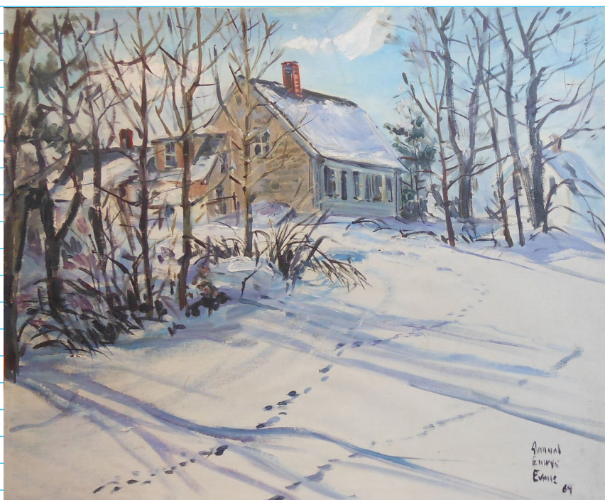
La Maison isolée © Em' aquarelle

Maison enneigée du Maine © Samuel Emrys Evans